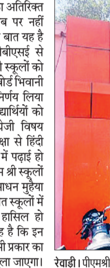
रेवाड़ी। पीएम श्री राजकीय वरिष्ठ माध्यमिक विद्यालय कापड़ीवा, पीएम श्री राजकीय वरिष्ठ माध्यमिक विद्यालय बावल।

में किसी तरह की फीस का अतिरिक्त भार अभिभावकों की जेब पर नहीं डाला जाएगा। सबसे बड़ी बात यह है कि पीएम श्री स्कूल सीबीएसई से संबद्ध हैं, जबकि सीएम श्री स्कूलों को हरियाणा विद्यालय शिक्षा बोर्ड बिधानी से ही संबद्ध रखने का निर्णय लिया गया है। इन स्कूलों में विद्यार्थियों को पहली कक्षा से ही अंग्रेजी विषय पढ़ाया जाएगा। दूसरी कक्षा से हिंदी और अंग्रेजी दोनों विषयों में पढ़ाई हो सकेगी। इन स्कूलों में पीएम श्री स्कूलों की तर्ज पर ही बेहतर संसाधन मुहैया कराए जाएंगे, ताकि चयनित स्कूलों में बच्चों को बेहतर शिक्षा हासिल हो सके। सबसे बड़ी बात यह है कि इन स्कूलों में बच्चों से किसी भी प्रकार का अतिरिक्त शुल्क नहीं वसूला जाएगा।