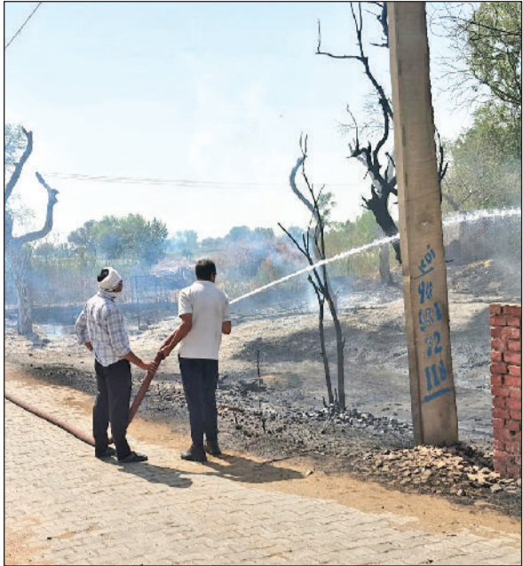
रेवाड़ी। जैनाबाद में लगी आग पर काबू पाते ग्रामीण।