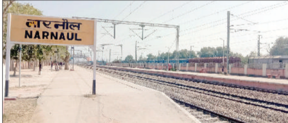
नारनौल। रेलवे स्टेशन।

■ भावनगर टर्मिनस-शकूरबस्ती साप्ताहिक स्पेशल रेलसेवा 29 मई से 26 जून व शकूरबस्ती-भावनगर टर्मिनस साप्ताहिक स्पेशल रेलसेवा 30 मई से 27 जून तक होगी संचालित