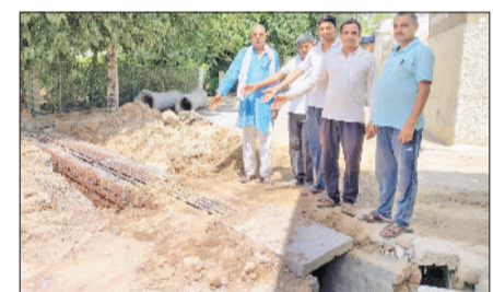
मंडी अटेली। सागरपुर में सड़क के बीच नाले को दिखाते ग्रामीण।

सिंहमा अटेली सड़क मार्ग पर गांव सागरपुर में सड़क के बीच बनाए गए नाले के कारण पिछले करीब 10 दिनों से यातायात प्रभावित बना हुआ है। लोक निर्माण विभाग की ओर से नाले का निर्माण कार्य तो कर दिया गया, लेकिन इसके बाद सड़क की मरम्मत नहीं की गई। जिससे मार्ग अब तक सुचारू नहीं हो पाया है। इस लापरवाही के चलते स्थानीय लोगों और राहगीरों को भारी परेशानी का सामना करना पड़ रहा है। स्थिति यह है कि छोटे और बड़े सभी वाहन सागरपुर की फिरनी के रास्ते होकर अटेली पहुंचने को मजबूर हैं। यह वैकल्पिक मार्ग लंबा होने के साथ कच्चा भी है, जिससे यातायात का दबाव बढ़ गया है और दुर्घटनाओं की आशंका भी बनी रहती है। खासकर किसानों एवं दैनिक आवागमन करने वाले लोगों को अधिक दिक्कत झेलनी पड़ रही है। ग्रामीणों का कहना है कि इस सड़क मार्ग पर प्रतिदिन हजारों की संख्या में वाहन गुजरते हैं। ऐसे में सड़क के बीच नाला बनाकर उसे अधूरा छोड़ देना विभाग की कार्यशैली पर सवाल खड़े करता है। लोगों का आरोप है कि नाला निर्माण के बाद तुरंत सड़क को दुरुस्त कर यातायात बहाल किया जाना चाहिए था, लेकिन विभाग इस ओर गंभीर नजर नहीं आ रहा। बताया जा रहा है कि यह नाला गांव के गंदे पानी की निकासी के लिए बनाया गया है, जो आगे जोड़ड़ में जाकर गिरता है। ग्रामीणों ने